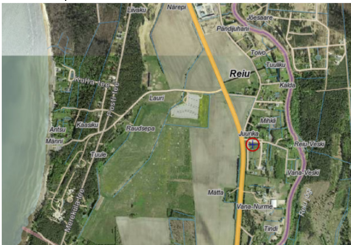
Joonis 1.1. Projekteeritud objekti asukohaplaan